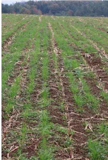
Weidelgrasuntersaat mit Schleppschuh ausgebracht

Das Futtergras entwickelt sich relativ langsam unter dem Mais, kann aber unter günstigen Bedingungen im Spätherbst noch abgeweidet (als ÖvF nur mit Schafen oder Ziegen) oder im Frühjahr, bei ausreichenden Niederschlägen für den nachfolgenden Mais, siliert werden.