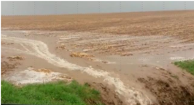
Abschwemmung in den Vorfluter von einem frisch bestellten Acker (geringe Hangneigung, Hanglänge ca. 450 m, 30 l in 20 min) im April 2018

Selbst bei geringen Hangneigungen finden während und nach Starkregenereignissen Abschwemmungen von Bodenmaterial und auch Erosion in größerem Ausmaß statt. Diese Erkenntnis konnte in diesem Jahr vielerorts vertieft beobachtet werden (siehe Foto).